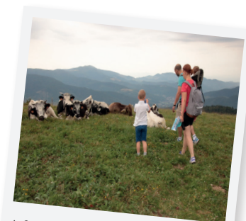
LES VACHES FONT PARTIE DU PAYSAGE