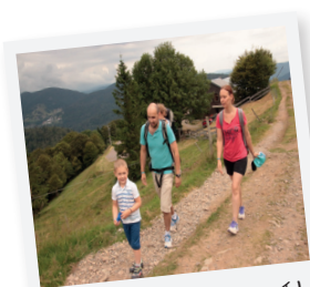
EN ROUTE VERS LE SOMMET !