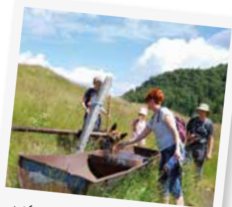
IL Y EN A POUR TOUT LE MONDE !