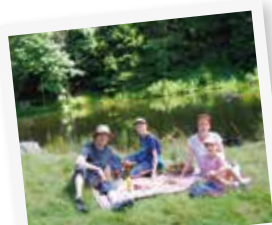
PIQUE-NIQUE EN FAMILLE !